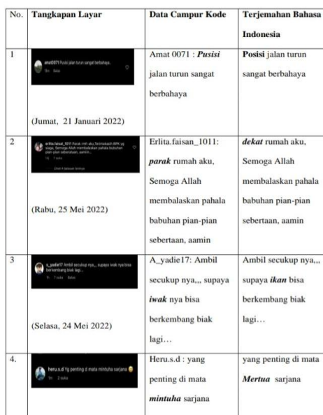
Tab 1. Data Campur Kode

Penulis memperoleh data dari hasil membaca dan mengambil tangkapan layar di kolom komentar akun Instagram Wargabanua. Berikut ini adalah Data Campur Kode dan tangkapan layar dalam hasil penelitian tentang campur dalam komentar akun Instagram Wargabanua: